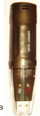
TAUPE Log USB